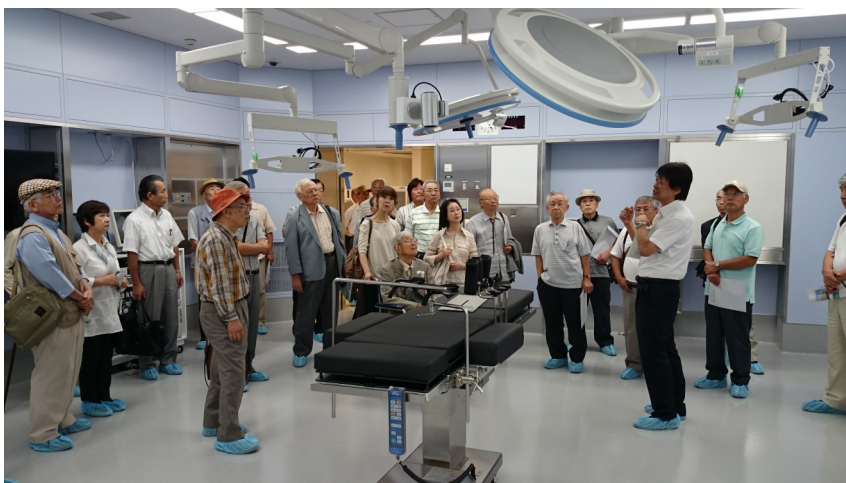
【写真】3階の手術室で事務局長から説明を受ける参加者

「市立ひらかた病院」の概要 アクセスは、枚方市禁野本町2-14-1。電話072-847-2821 FAX072-847-2825。